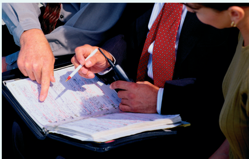
Übersichtlich und sicher überwachen Sie Ihre Termine mit dem Termin- und Jobverwaltungssystem von BASIS.

■ Auswertungen und Statistiken stellen Sie aus dem gesamten System in Inhalt, Form, Reihenfolge, Summenbildung etc. mit variablen Instrumenten selbst zusammen.