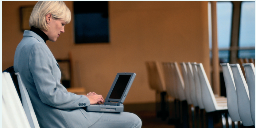
Auf der strukturellen Basis der Software21 können wir auch Lösungen für Randgebiete des Verlagsgeschäftes bereitstellen.

Heute liegt die Software21 in der fünften Generation vor. Es gehört zu unserem Entwicklungskonzept, für jeden Generationswechsel die erforderlichen Umstellungswerkzeuge bereit zu stellen. So ermöglichen wir Erweiterungen von Funktionalität mit nahtlosen Übergängen.