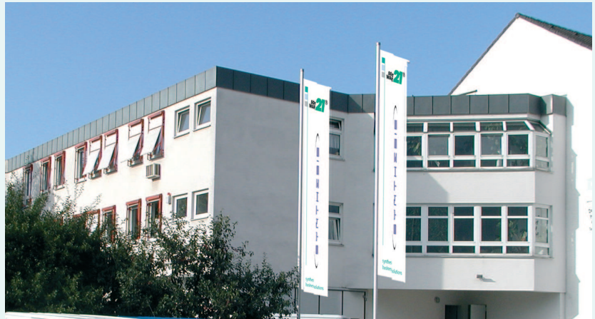
Seit 1984 haben wir unseren Firmensitz in Waiblingen.

Dazu gehört für uns, neue Technologien und neue Trends im Markt ständig zu beobachten und zu prüfen. Zum Einsatz kommen sie dann, wenn